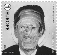
© bpost 5271 ①E Pol Bury: portrait d'Achille Chavée " au mélangeur" ©Sabam-Belgium 2024