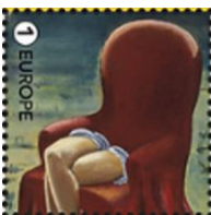
© bpost 5272-Øv ①E Jane Graverol: Le Cortège d'Orphée, 1948

Timbres avec vignet--images contiguës cohérentes