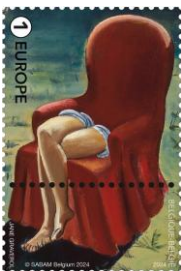
© bpost 5272 ①E 1 Roger Van de Wouwer: Portrait Paul Nougé