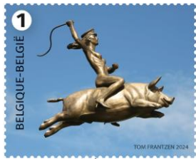
© bpost 5269 ① Le Vénus de Duisburg, 2007

Rem: V10-5269 est plus grand qu'un A4 format ???