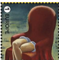
5272-Øv ①E Jane Graverol: Le Cortège d'Orphée, 1948

Timbres avec vignet--images contiguës cohérentes