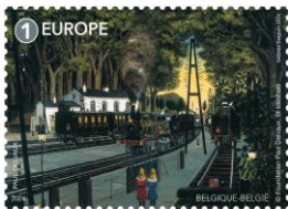
© bpost 5274 ①E Paul Delvaux: La gare forestière ©Foundation Paul Felvaux, St- Idesbald ©Sabam-Belgium 2024

Timbres avec vignet--images contiguës cohérentes