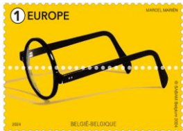
© bpost 5270 ①E L'Introvable ©Sabam-Belgium 2024

Prévente : 24/08/2024 Émission: 26/08/2024 Impression: offset: — Philanews N°. 3 / 2024 (pg. 12 - 13) — © bpost Format: — timbres 5270 + 5274: 48 x 32mm ; — timbre 5271: 32 x 32mm; — timbres 5272 / 5273: 32 x 48mm; — bloc BL334: 135mm x 187mm Perforation: 11½ Papier: Gbl (FSC)