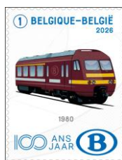
5374 1967- Post